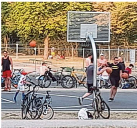
Auch ein Streetball-Feld gehört dazu.

Ein schon zuvor vorhandener Bolzplatz, der lediglich aus zwei Toren auf einem Wiesenstück bestand, wurde verlegt und mit einem wassergebundenen Belag versehen. Der neue Bolzplatz und die Rasenflächen drumher-