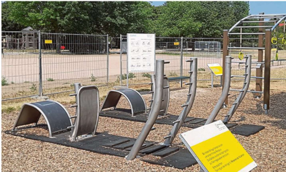
Der Fitness-Parcours komplettiert den Lohsepark.