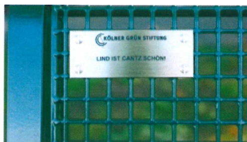
Cantz' tolle Botschaften

An einem Feldweg in Porz-Lind stehen jetzt zwei Sitzbänke inklusive kleiner Botschaften auf Messingschildern (wurden am Morgen erst montiert): „Lind ist Cantz schön!“ und „Porz hat Cantz gute Aussichten!“