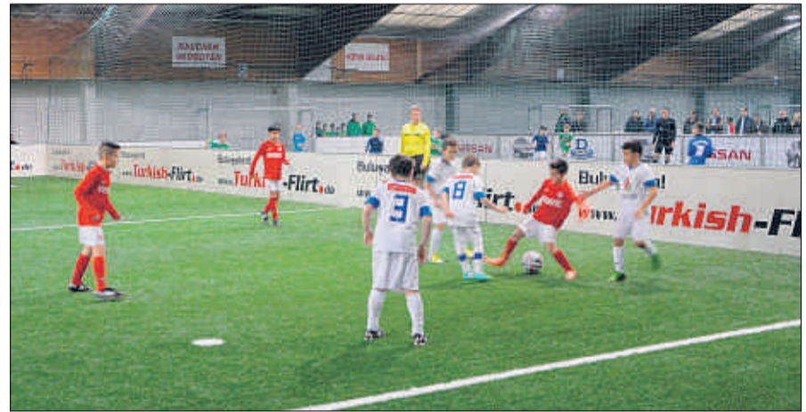
Das Hallenturnier bot viele spannende Begegnungen.