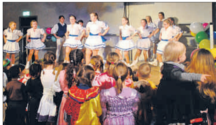
Da bestaunt das Publikum die Nachwuchstänzerinnen.

die Junioren die Bühne, mal eroberten sie den Saal und veranstalteten eine Polonaise. Doch diese Kindersitzung wird nicht das letzte Mal sein, bei dem der Lino-Club im Karneval mitmischte. „Wir werden in diesem Jubiläumsjahr mit einer Gruppe von 320 Teilnehmern beim Longericher Veedelszoch mitgehen“, so Gau.