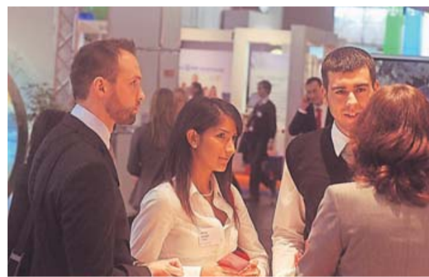
In der Halle 8 präsentieren sich die Unternehmen.

Neben dem Zukunftskongress ist der Absolventenkongress Deutschland für Berufsstarter und Young Professionals die Chance, in un-