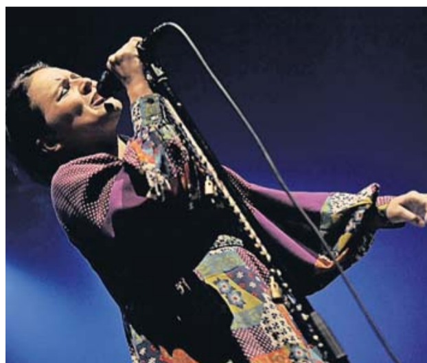
Die isländische Sängerin Emiliana Torrini ist heute Abend zu Gast im Gloria an der Apostelstraße.

* Gloria Theater , Emiliana Torrini, Tookah-Tour, 20 Uhr, Apostelstraße 11, Tel. 0221/660 6 30, www.gloria-theater.com