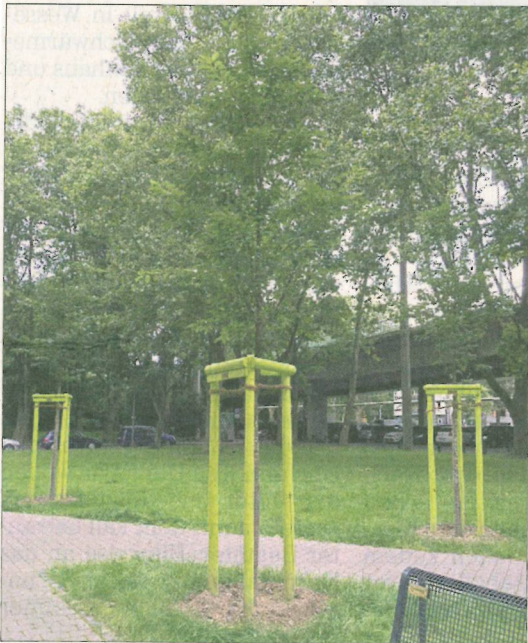
Von der Kölner Grün Stiftung aufgestellte Spenderbäume am Holz- markt.