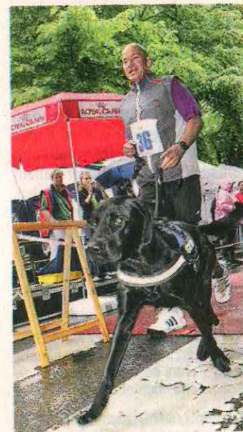
Geschafft: Hund mit Herrchen im Ziel.