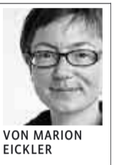
VON MARION EICKLER

Der Pauliplatz kann nur saniert werden, wenn die Anwohner des Platzes und der angrenzenden Straßen tief in die Tasche greifen. Ihre Teilnahme an dem Projekt ist freiwillig, wünschens- und lobenswert; das Engagement der Bürger – auch das finanzielle – in Zeiten knapper Kassen ist notwendig. Doch muss es die Öffentlichkeit hellhörig machen, wenn mit der Finanzierung eigentlich städtischer Leistungen im öffentlichen Raum durch Privatpersonen – hier die Sanierung einer Grünfläche und eines Spielplatzes – Forderungen verbunden werden, die nicht im Sinne der Allgemeinheit sein können.