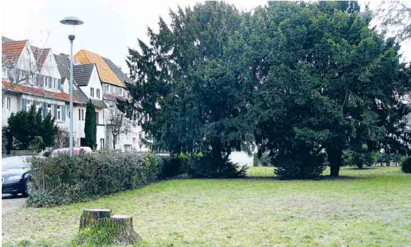
Mittlerweile mussten auf dem über viele Jahre vernachlässigten Pauliplatz einige kranke Bäume gefällt werden.

Neuehrenfeld. Zwei Hybridpappeln wurden im „Rosengärtchen“ an der Ecke von Baadenberger und Ossendorfer Straße gefällt. Die jeweils etwa 20 Meter hohen Bäume wurden schon vor drei Jahren stark gestutzt. Nun löste sich die Rinde vom Stamm, so dass die Pappeln nach Angaben des Grünflächenamtes nicht mehr lebensfähig sind. Zugleich wurde dort an einer Eiche totes Holz entfernt. Um den einen halben Hektar großen Grünstreifen gab es vor rund vier Jahren Streit, als die Stadt Pläne für den Bau von Einfamilienhäusern vorstellte. Eine Bürgerinitiative verhinderte dies erfolgreich. (Rös)