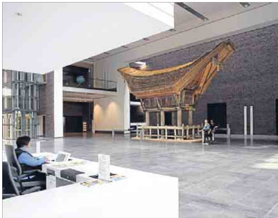
Schick, aber leider auch unpraktisch: Die Empfangstheke im Rautenstrauch-Joest-Museum, das vor elf Monaten eröffnet worden ist. Rechnungsprüfer kritisieren eine Reihe von Mängeln.

Symbole des Bildschirms oder an die Kassenschublade zu kommen, weil Monitore und Schubladen zu tief angebracht worden seien. Die Museumsverwaltung hat daraufhin mitgeteilt, dass die Arbeitsplatzsituation schon gegenüber dem Architekten bemängelt worden sei. (hap)