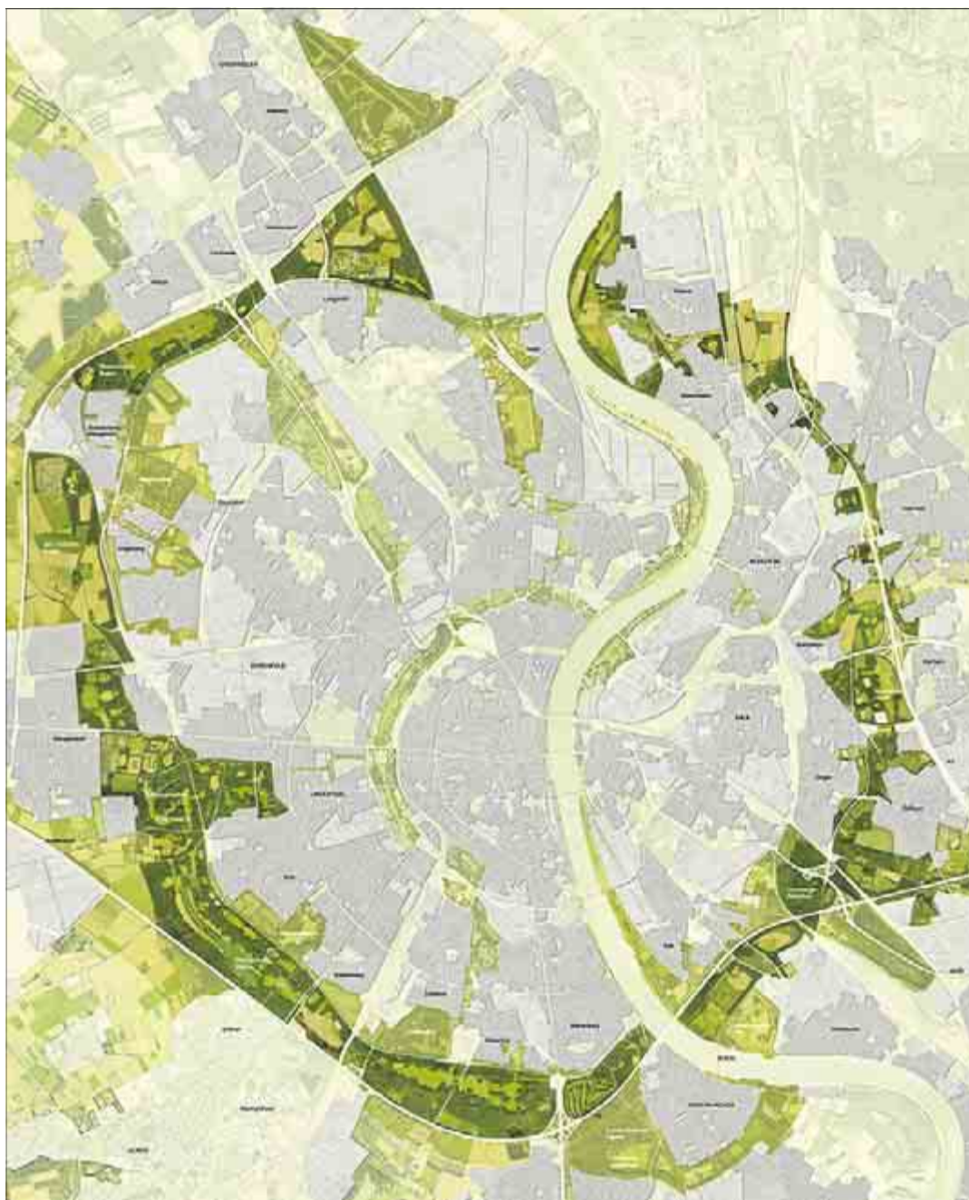
Rund sieben Prozent des gesamten Kölner Stadtgebietes macht der hier dunkelgrün hervorgehobene Äußere Grüngürtel aus. (Darstellung: WGF Landschaft/Albert Speer und Partner)

Der Plan soll erst zusammen mit der Fachöffentlichkeit, aber auch den direkt betroffenen Bürgern entstehen. Worum es geht, zeigen am besten die Fragen, die Bauer formuliert: „Wie können wir den Grüngürtel vor allem im Rechtsrheinischen vervollständigen? Wie können wir Barrieren überwinden wie am Eifeltor? Wie kann man Naturschutz und Nutzung in Einklang bringen? Welche Art Be-